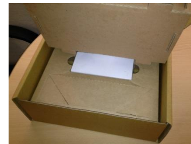
3. 下段は電源アダプタとコード