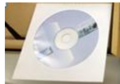
2. マニュアル CD