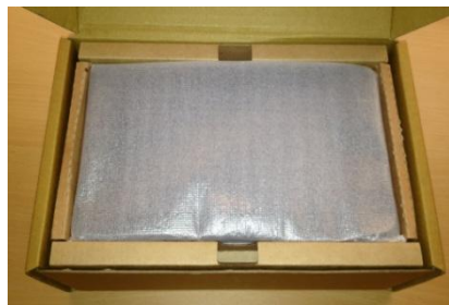
1. 上段は TB100